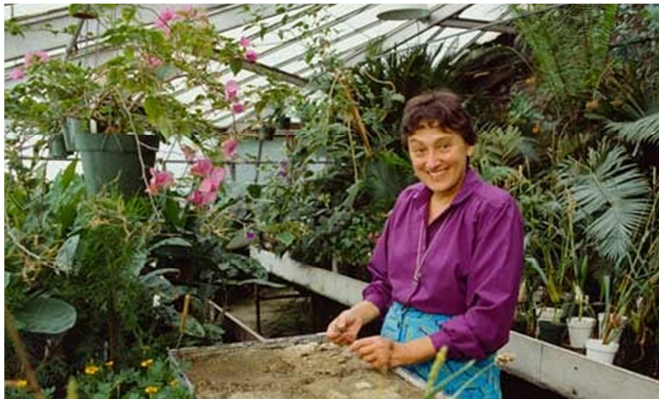
Lynn Margulis, (1938-2011), biòloga nord-americana.