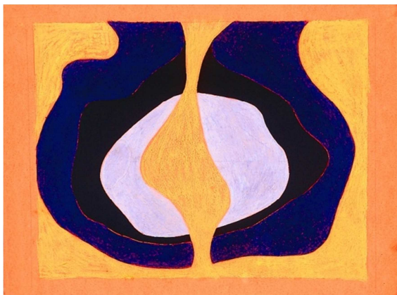
Vaginal I, 1966. Cera sobre cartolina. 46 x 60 cm

Feminista, poeta i activista , la seua obra va rebre un reconeixement important fa dos anys quan la Tate Modern de Londres va escollir dos quadres seus: 'La gran vagina' (1966) i 'Coitus pop' (1968) per a la mostra col·lectiva 'The world goes pop'. Els últims mesos també el Museu Reina Sofia de Madrid s'ha interessat en les seues creacions.