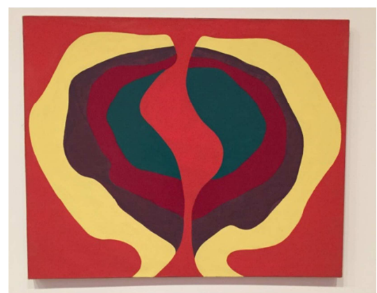
La gran vagina, 1966.